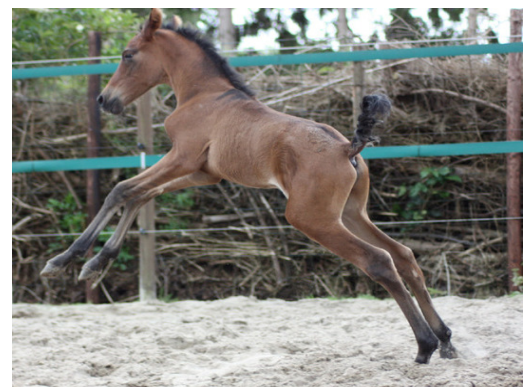
Mistico, hengstveulen 2009, gefokt door Yeguada la Vida Nueva

Op de website www.ancce.es vindt u altijd de laatste nieuwe stamboekinformatie, wedstrijduitslagen en nog véél meer.